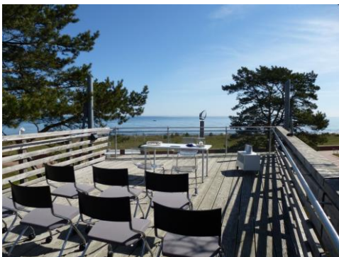
Trauung auf dem Steg mit Ostseeblick