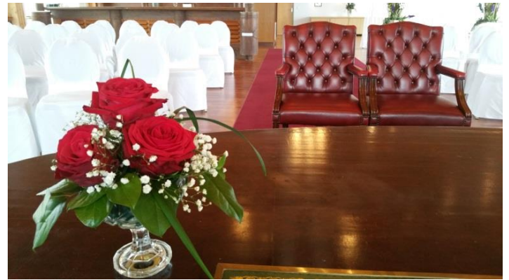
Balticsaal – Seebrücke Sellin