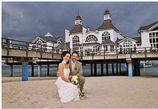
Strand vor der Seebrücke

Ein besonderer Höhepunkt ist das Läuten der Schiffsglocke, welche die Nachricht Ihrer Verbindung weit über das Wasser trägt.