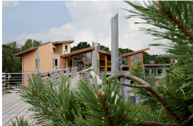
Blick auf das „Haus des Gastes“ mit der Hochzeitsgalerie

Hier können Sie auch im Anschluss der Trauung unvergessliche Fotos machen - hoch über der Ostsee.