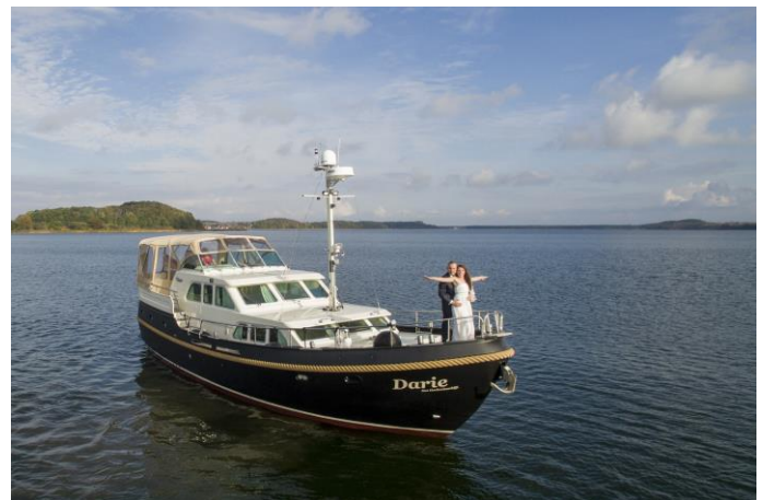
Außenstelle - Schiff „Darie“

Für alle, die vom Wasser nicht genug bekommen können, bieten wir die Trauung auf einer Yacht in den Häfen von Sellin, Thiessow, Baabe oder Gager an. Die Halbinsel Mönchgut oder auch die Insel Vilm immer im Blick, genießen Sie die Unbeschwertheit Ihrer Trauung allein oder mit max. 6 Gästen. Catering und Sektempfang im Anschluss sind möglich.