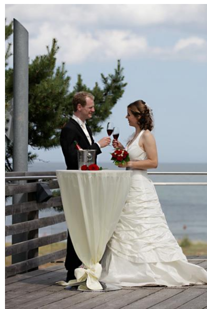
Außensteg am „Haus des Gastes“ – trauen Sie sich hoch über der Ostsee