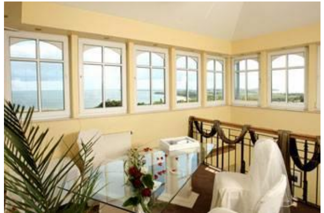
Turmzimmer im Vju Hotel (ehem. Hanseatic)