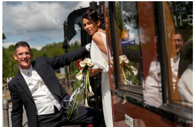
Hochzeit im Rasenden Roland

Das absolute Highlight des Hotels ist aber die Trauung am Strand . Mit Blick auf die Ostsee geben Sie sich hier das „Ja-Wort“ geben. Eisenbahnromantiker können sich auch im Rasenden Roland trauen lassen (max. 6 Gäste).