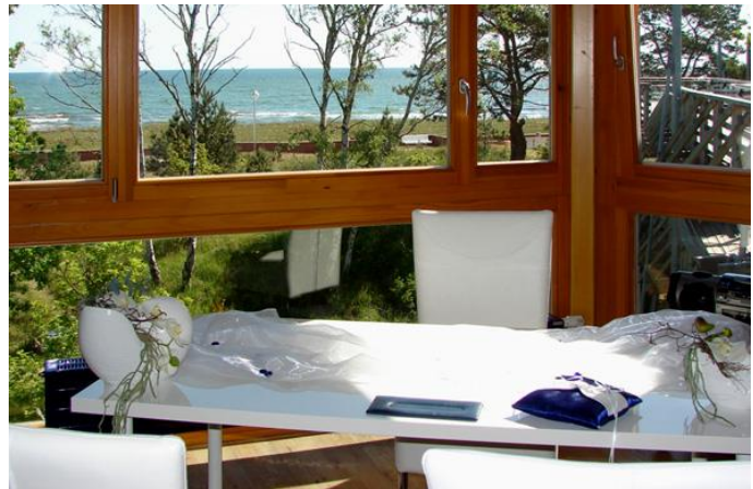
Hochzeitsgalerie mit Blick auf die Ostsee