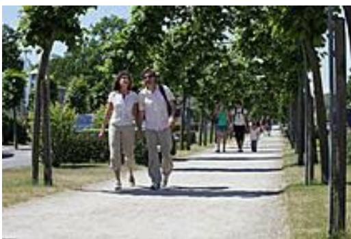
Allee Strandstraße in Baabe