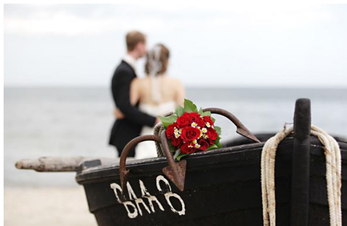
Ambiente am Strand mit traditionellem Fischerboot

Mail mit Ihrer Anfrage, diese beantworten wir dann umgehend.